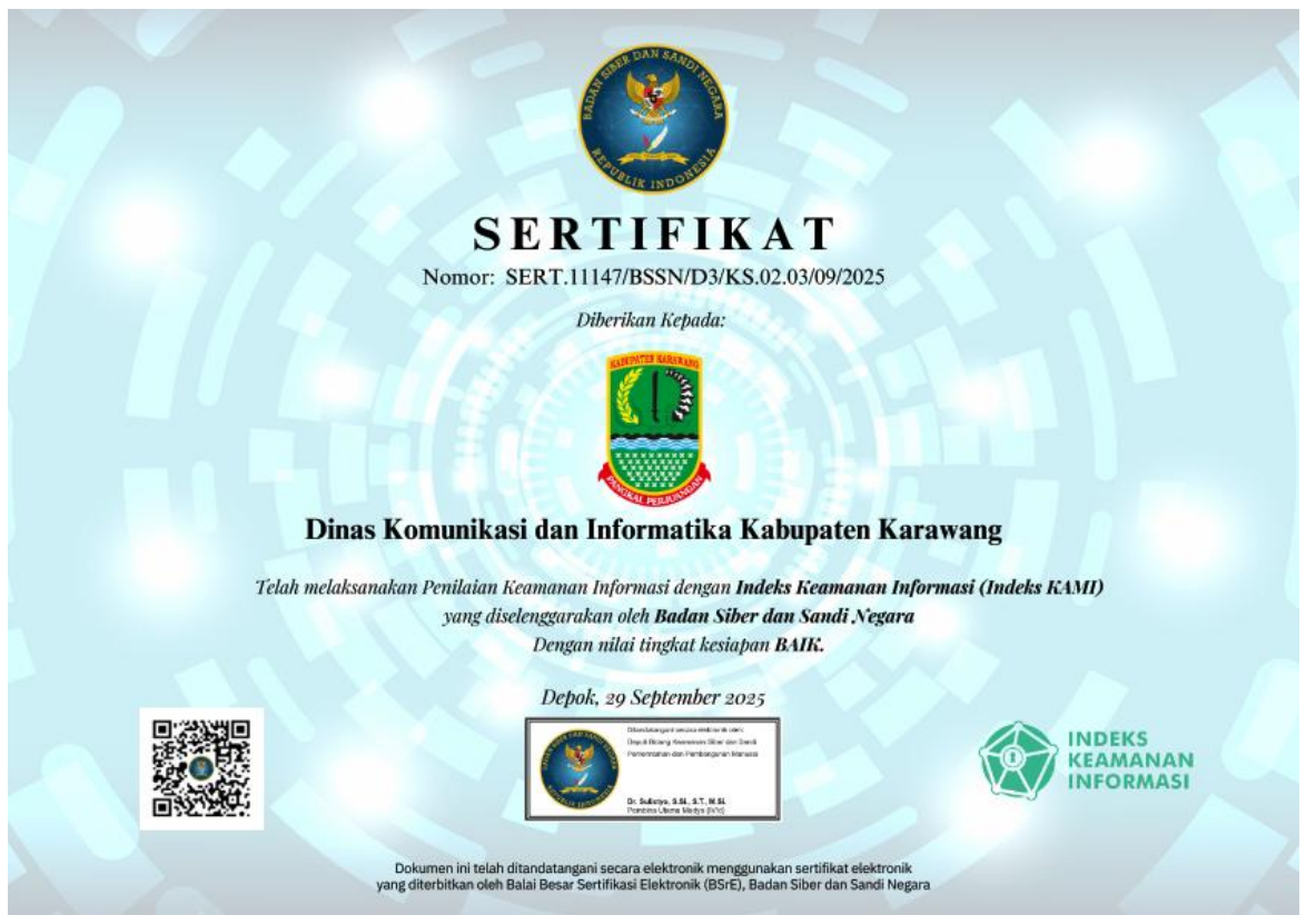
Gambar 3. 3 Sertifikat Penghargaan Diskominfo

Dalam pencapaian IKU Indeks Keamanan Informasi tahun 2025 terdapat hambatan dan strategi antara lain :