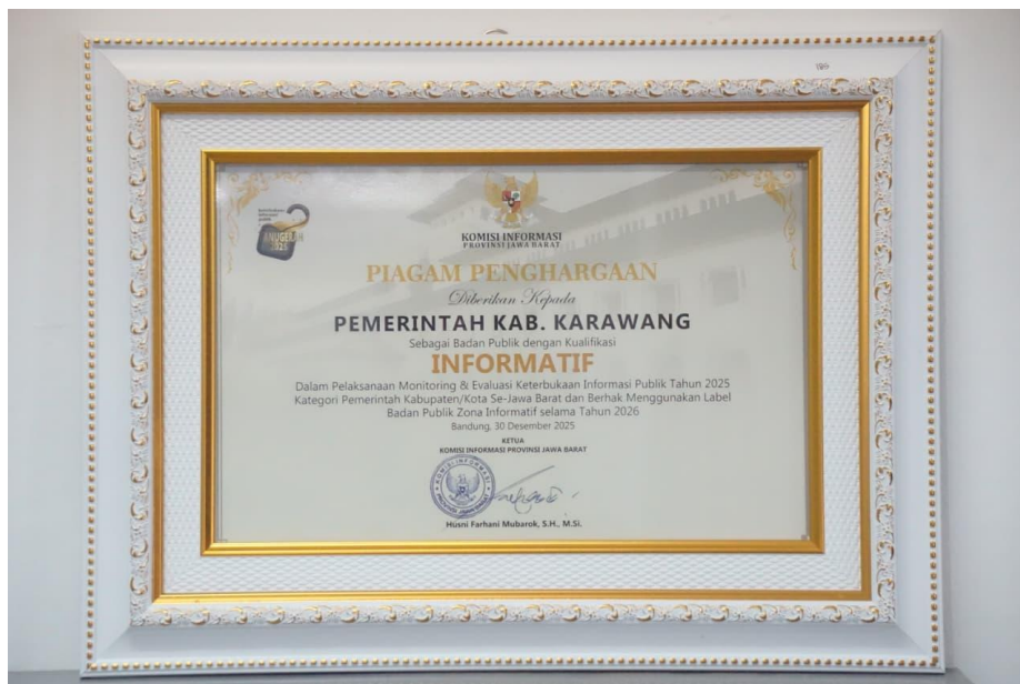
Gambar 3. 1 Sertifikat Penghargaan

Penilaian Keterbukaan Informasi Publik menargetkan predikat Informatif , dan realisasi tahun 2025 berhasil mempertahankan predikat yang sama dengan tingkat capaian 100%. Hal ini menunjukkan bahwa pengelolaan informasi publik telah dilaksanakan secara optimal, sesuai dengan prinsip transparansi dan akuntabilitas.